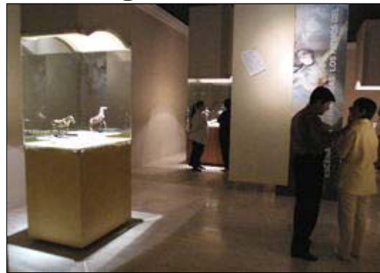
La exposición Edgar Degas, escultor se inaugura este jueves a las 19:00 horas en el Museo Nacional de San Carlos.

Ciudad de México (18 junio 2002). - Aunque la leyenda asegura que Edgar Degas no realizó esculturas hasta que se quedó ciego, los 73 bronce que serán presentados en México desde el 20 de junio demuestran que el trabajo en cera fue una técnica que siempre interesó al artista.